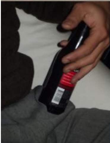
Ray Zijlstra – photo dL&P