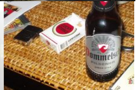
Thom deLagh – photo dL&P